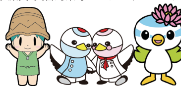
蓮田市商工会 人間総合科学大学 @蓮田市